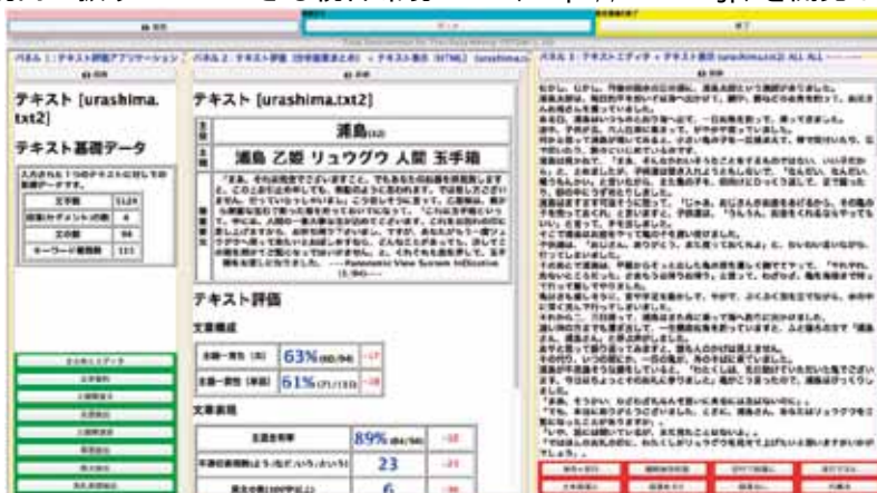
図1 TETDMによるテキスト分析結果の表示例

データの有効活用を見込むニーズに対して、本統合環境をカスタマイズして、多様な目的に活用できます。