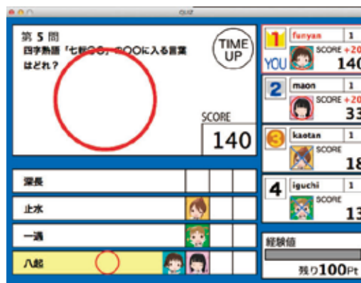
図3 オンラインゲームによる学習システム