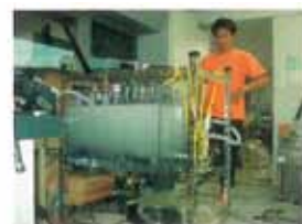
加圧溶解法により生じたマイクロバブル

そこで、マイクロバブルを効率よく生成させる装置や方法を開発するとともに、液中への気体の溶解促進効果の確認・びわ湖等の深度をもった大規模水域の水質浄化の基礎研究、管内乱流の摩擦抵抗低減にマイクロバブルを利用する方法についての研究、更にわれわれの生活の中にマイクロバブルを取り入れて生活をより豊かにする研究にも取り組んでいる。